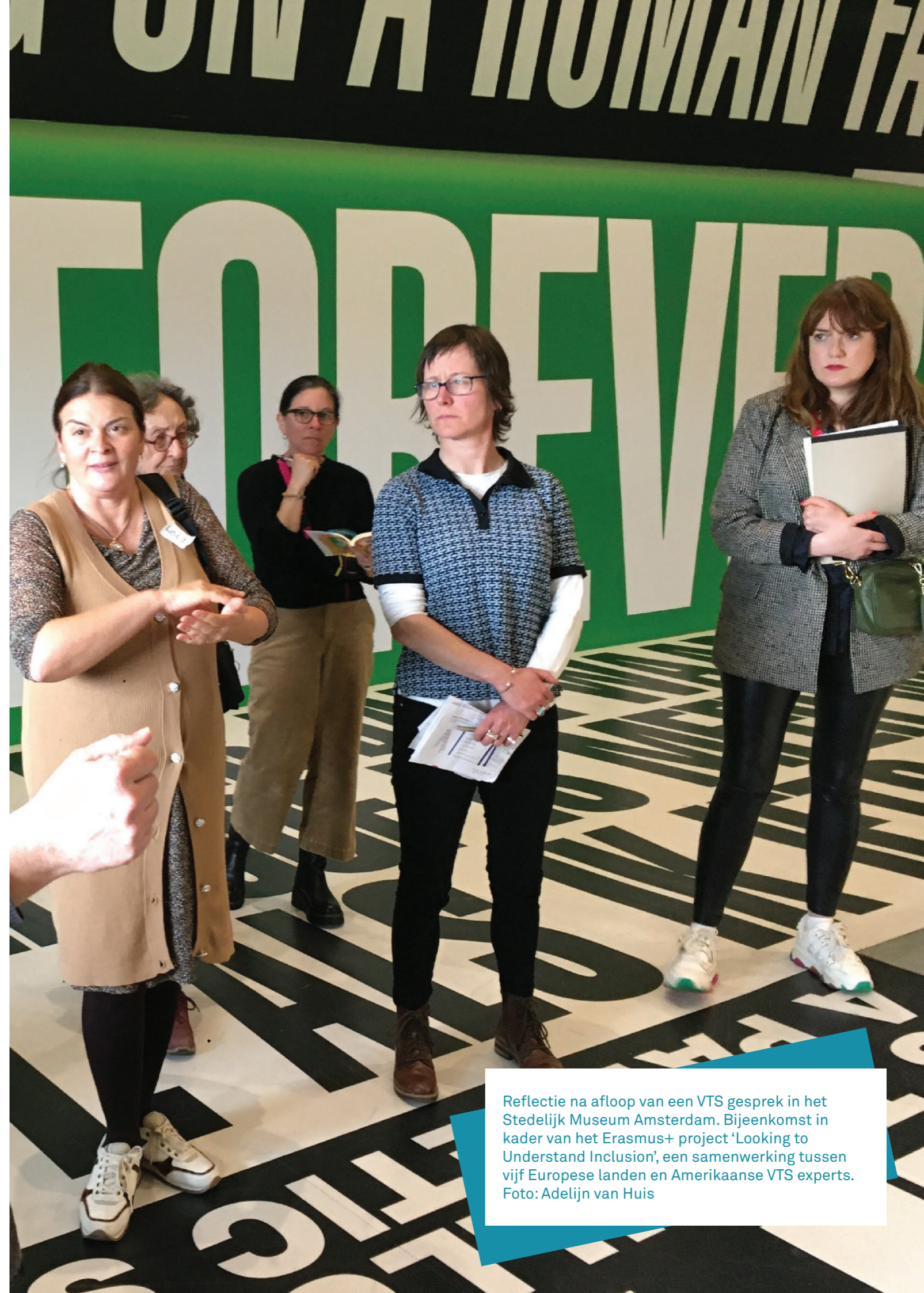
Reflectie na afloop van een VTS gesprek in het Stedelijk Museum Amsterdam. Bijeenkomst in kader van het Erasmus+ project 'Looking to Understand Inclusion', een samenwerking tussen vijf Europese landen en Amerikaanse VTS experts.

We richten ons met scholing en advies op professionals in het onderwijs, de culturele sector en de zorg. We delen kennis, werken samen met partners, initiëren (internationale) projecten en spannen ons in voor een actief netwerk van VTS gespreksleiders. We streven naar inclusie, zowel binnen onze organisatie als met ons aanbod.