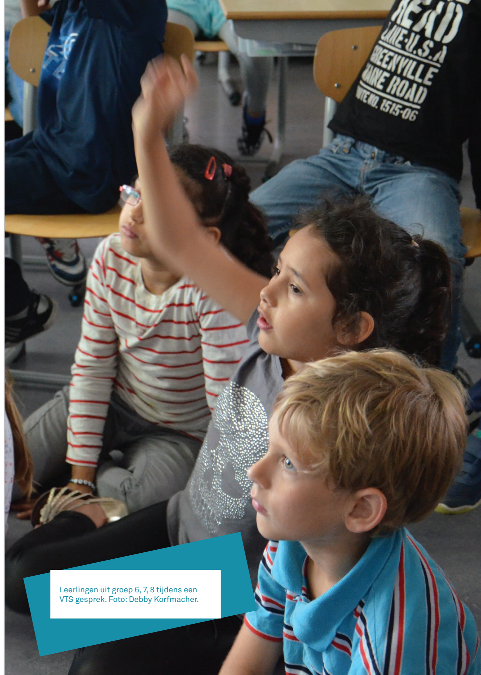
Leerlingen uit groep 6, 7, 8 tijdens een VTS gesprek.

Culturele organisaties bieden bezoekers een grote hoeveelheid (visuele) informatie die zij 'lezen', ordenen, interpreteren en beoordelen. Lange tijd is dit proces vormgegeven in educatieprogramma's die kennisoverdracht voorop stelden. Men vroeg zich niet af hoe de geboden informatie beklijfde en hoe en of het bijdroeg aan persoonlijke betrokkenheid en ontwikkeling van de bezoeker. Vandaag de dag willen veel culturele instellingen toegankelijk